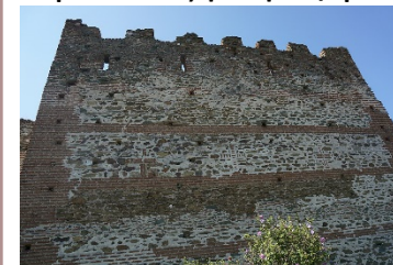
Εικόνα: Άποψη των τειχών της Θεσσαλονίκης

( https://commons.wikimedia.org/wiki/File:Mur_avec_croix_dedans_00109.JPG [ημ. πρόσβασης: 10.02.2024]).